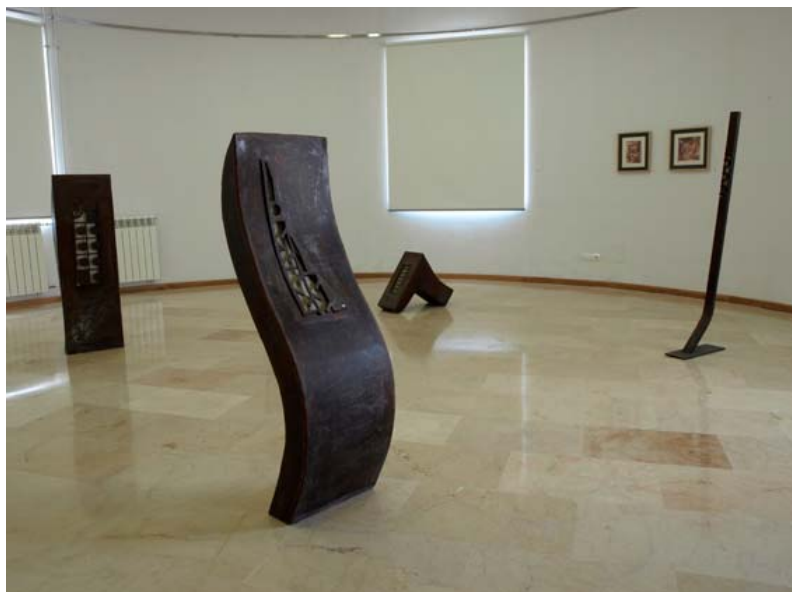
Vista de la obra de Tirador en la Sala de Exposiciones del IBQ