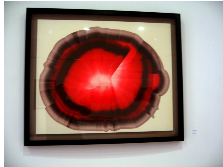
Alejandro Mieres, Floración roja , 2000.