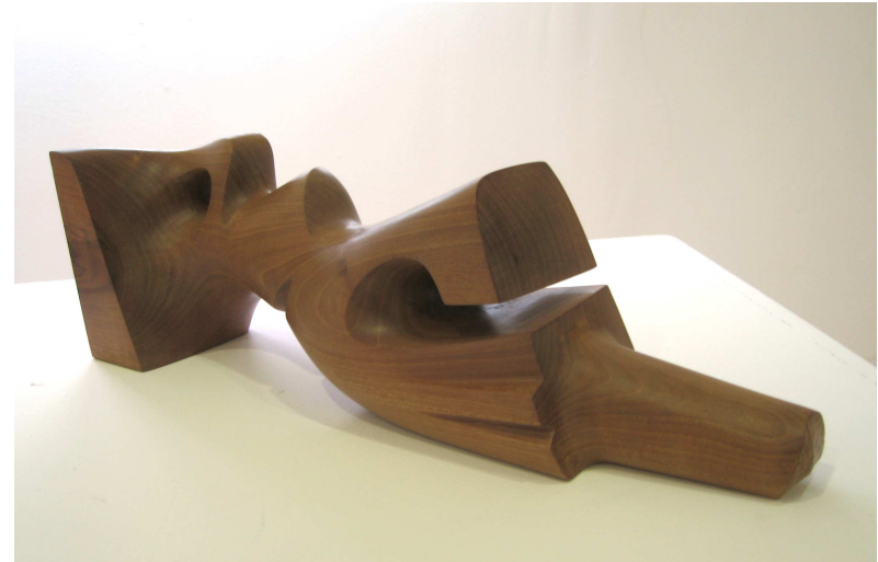
Arriba obra de la serie Torsos , de José Luis Fernández. Abajo Sin título de Legazpi.