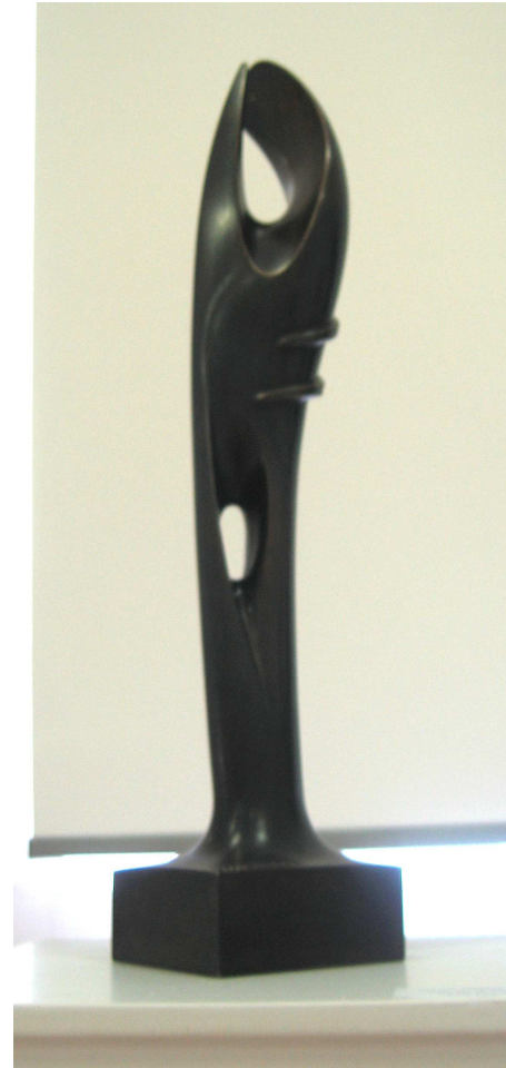
José Luis Fernández, Serie columnas , 2004.