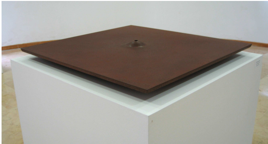
Fernando Alba, Un lugar en el espacio , 2010.