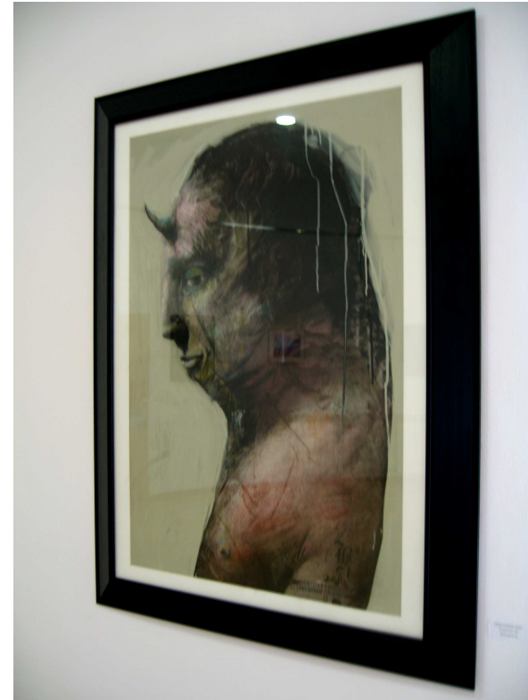
Kiker, El unicornio azul .