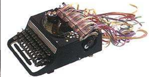
Arriba Yacht y Contes de J. Brossa.