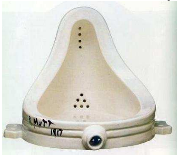
Arriba Fuente , de M. Duchamp 1917.