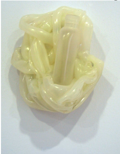
Una escultura en plástico de Manuel Calvo Abad.