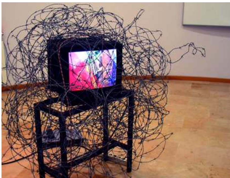
Detalle de materiales y texturas en la videoinstalación "Simultaneidad". Se han utilizado 200m de alambre para atrapar este televisor.