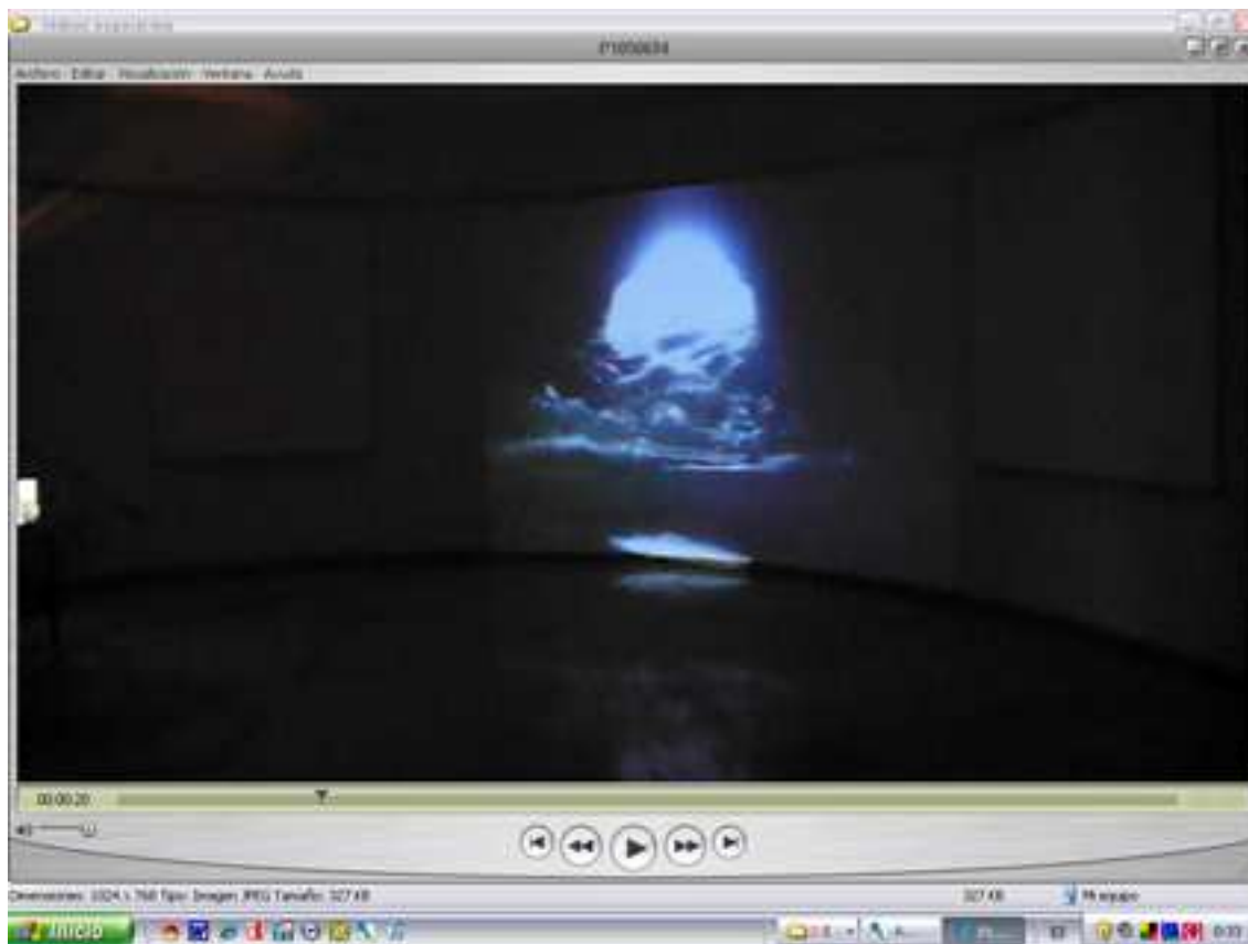
Imagen de video-instalación. Sobre la pared curva, la proyección de grandes dimensiones representa una cavidad en la que penetra con fuerza el mar. La pared curva, las enormes dimensiones de la imagen, el sonido de la mar batida y su reflejo en el suelo, impactan. El mar, poderoso, inunda este cilindro que es la sala de exposiciones. Interesante ejercicio de escala pues lo sorprendente es que, en realidad tan sólo estamos ante un pequeño agujero.

Es de especial interés para nosotros el capítulo referido al propio artista. En él, podemos ver imágenes de su estudio, del paisaje que le inspira, fragmentos de sus obras, sus pinturas, sus objetos. Y de su interior imágenes mentales representaciones de difícil acceso: pensamientos e inquietudes. Algunos aparecen como abstracciones, pero otros, más íntimos se visualizan con mucha concreción.