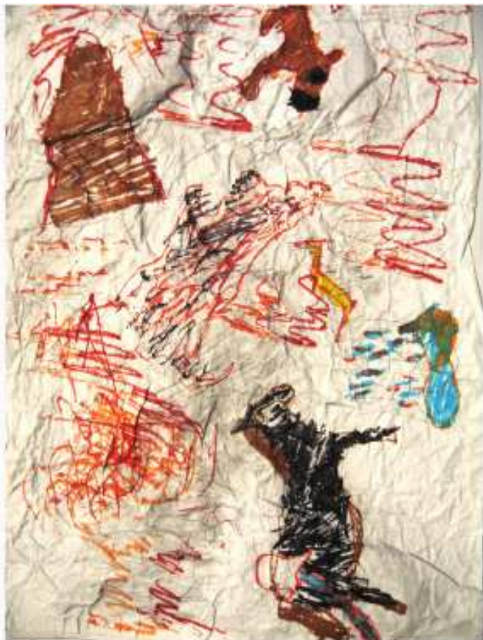
El gesto, la abstracción.

IBQ 12-Diciembre-2008 Materiales Didácticos. X. Antón García-Sampedro Vega