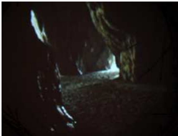
Importancia de la cueva en las dos video-instalaciones