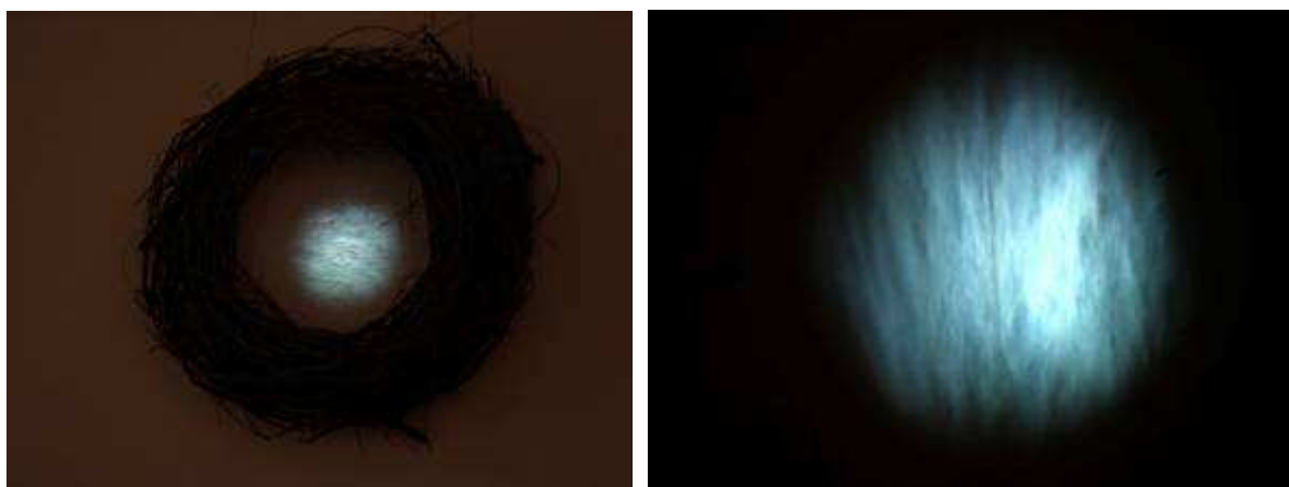
Distintos detalles de la proyección en la oscuridad. La imagen, en formato circular, está rodeada por una impresionante corona de espinas. El parpadeo de la pantalla, el azul del mar y su giro nos sugieren el dominio de un extraño monóculo.