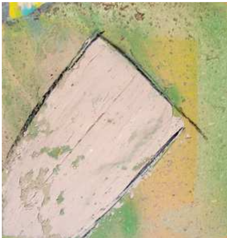
Monocromía y expresionismo en la pintura. Libertad y contención expresiva.