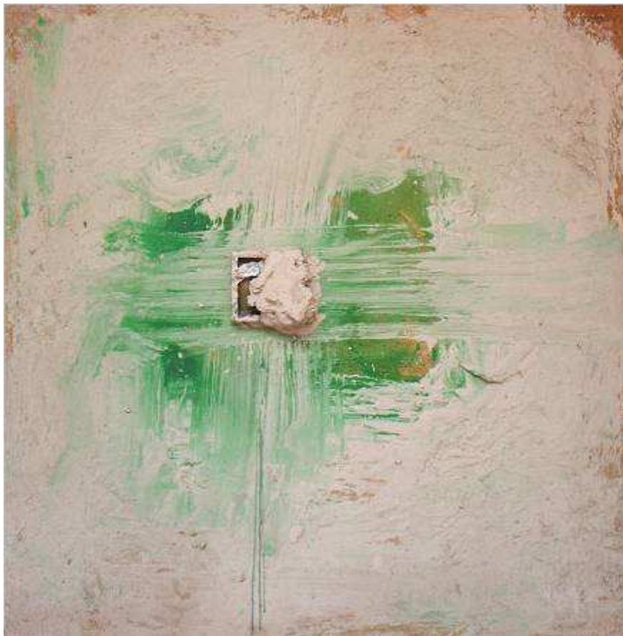
Cuadro del patio central y detalle. La energía que desprende la materia. Las direcciones horizontal y vertical subrayan la tensión.

Destaca en la parte central un resto de yeso seco, amorfo por la presión de los dedos del artista. Este elemento residual y producto del azar sobresale de la bidimensionalidad pictórica aportando además, gran potencia visual.