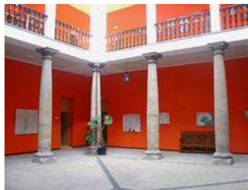
Vista general de la exposición

Se exponen una serie de pinturas de Vicente Pastor de la serie Simultaneidad , con distintos formatos. Destacan por la diversidad de texturas y materiales, colores, trazos, pero sobre todo por la energía que transmiten.