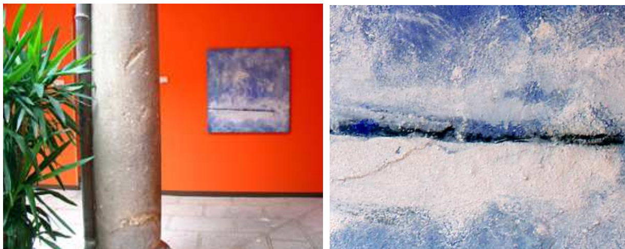
Materia y color en un detalle de este cuadro dominado por el azul. Una línea horizontal recorre el cuadro. Esta obra podría ser la abstracción de un paisaje atmosférico.